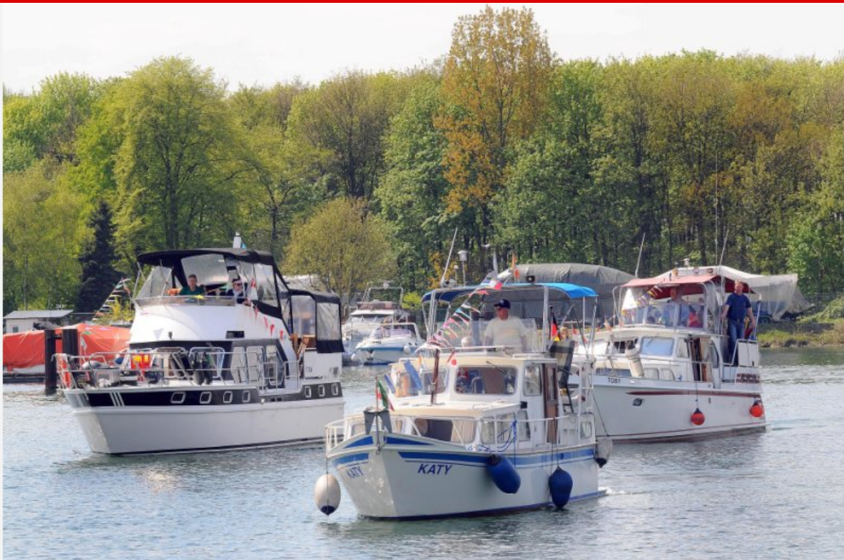
Eröffnete die Motorbootsaison: der WSV Herne.

HERNE. Bei idealem Wetter hat der Wassersportverein Herne (WSV) die Motorbootsaison eröffnet. Der Verein plant zwei neue Anlegestege und eine Modernisierung der Anlage.