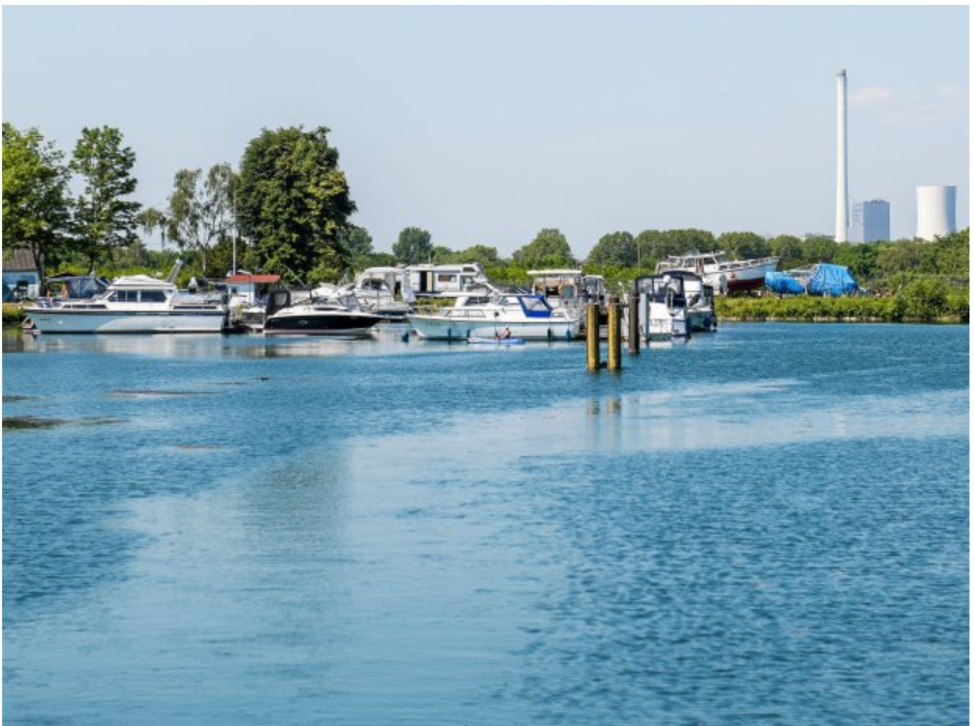
Einführung Yachthafen im Herner Meer.

Herne: Warten – und wieder spielen, sobald es geht